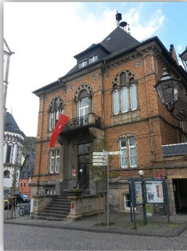
Außenansicht der Tourist Information Boppard