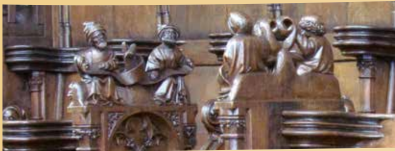
Stalles, L'église des Carmélites

Au-dessus de la chaire, la fresque raconte en 14 tableaux la légende de St Alexis, riche Romain qui renonça à l'aisance et au prestige pour consacrer sa vie aux pauvres, et qui vécut jusqu'à sa mort, pendant 17 ans, sous l'escalier de la maison paternelle, sans qu'on le sût. Les nombreuses représentations de la Vierge sont l'expression du culte tout particulier que voue l'ordre des Carmélites à Marie : Vierge baroque au rosaire, suspendue devant l'autel au-dessus des fidèles, piéta (1430), Madone debout à l'enfant (1480) sous la galerie et, près de l'escalier extérieur, madone à la grappe (1330) à laquelle, suivant une ancienne coutume, les vignerons viennent offrir les premières grappes des vendanges dans l'espoir d'une bonne récolte.