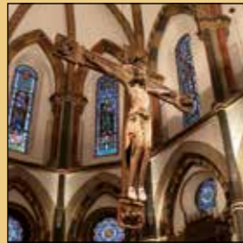
Croix triomphale, Église St Sever

Deux objets particulièrement remarquables de la décoration intérieure peuvent être datés de l'époque de la construction de l'église : la croix triomphale romane suspendue au-dessus du maître autel, portant le Christ couronné vainqueur de la mort, et la sculpture représentant la madone à l'enfant empreinte de douceur et au sourire délicat, portant un sceptre de lys. Les fresques de la nef centrale racontent l'histoire de St Sever, patron de l'église, qui de pauvre tisserand devint évêque de Ravenne. Dans la nef latérale de droite, les fresques du plafond représentent le Christ et des saints. Les vitraux datent de la seconde moitié du 19ème siècle, à l'exception de ceux de la nef de droite, oeuvre d'une artiste contemporaine de Boppard. Au dos de l'abside, plusieurs stèles funéraires datent de l'époque des premiers chrétiens ; les plus anciennes sont celles d'Armentarius et de Besontio (5ème / 6ème s.).