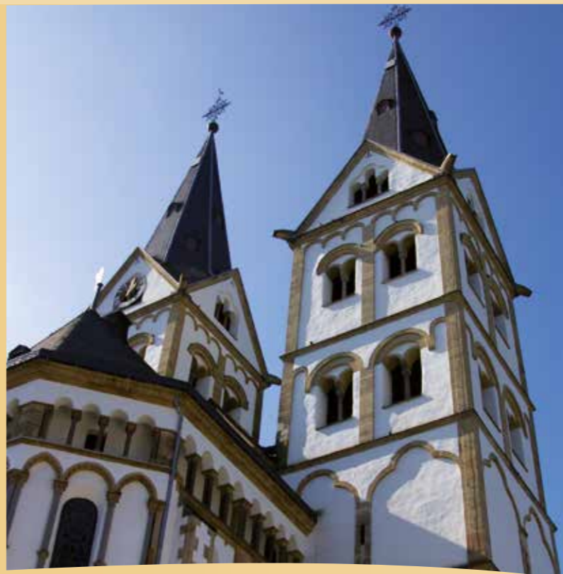
Iglesia San Severo

En la pared posterior de la iglesia hay varias lápidas incrustadas correspondientes a la iglesia de los primeros cristianos, de las cuales las piedras „Armentarius“ y „Besontio“ – son las más antiguas (siglo V/VI).