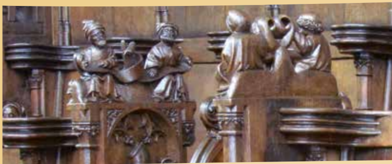
Sillería del coro, Iglesia Carmelita