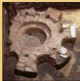
Pila bautismal, Iglesia San Severo

En la pared posterior de la iglesia hay varias lápidas incrustadas correspondientes a la iglesia de los primeros cristianos, de las cuales las piedras „Armentarius“ y „Besontio“ – son las más antiguas (siglo V/VI).