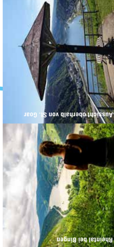
Rheintal bei Bingen