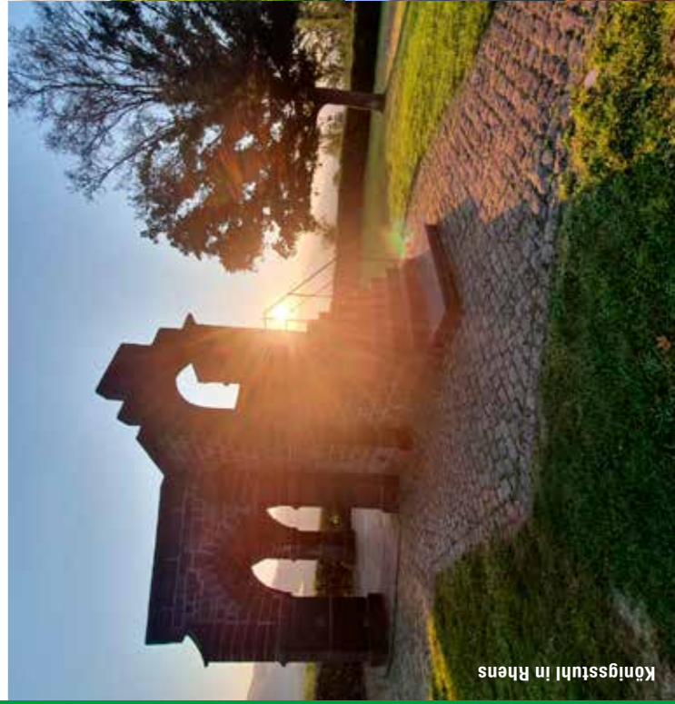
Königsstuhl in Rhens

Mehr Details finden Sie auch auf der Webseite www.welterbesteig-oberes-mittelrheintal.de