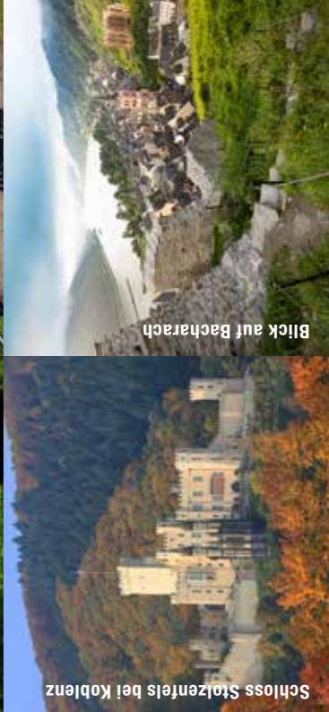
Schloss Stolzenfels bei Koblenz