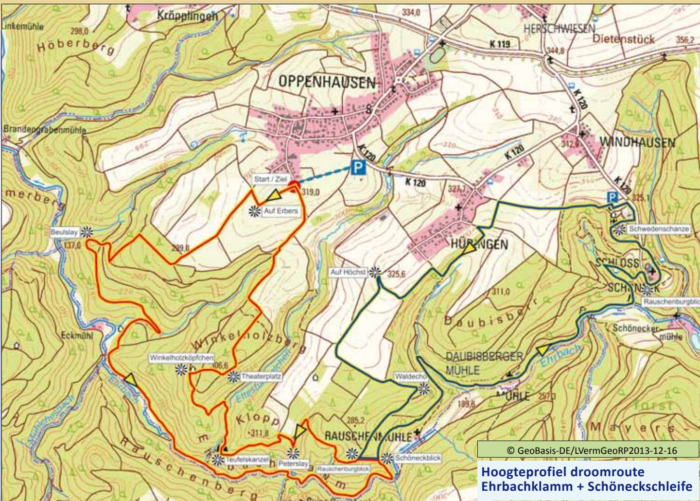
Hoogteprofiel droomroute Ehrbachklamm + Schöneckschleife

Lengte: 15,6 km 469 hoogtemeter Profiel: moeilijk Looptijd: ca. 6 uur Seizoen: gedurende het gehele jaar behalve bij ijs en sneeuw